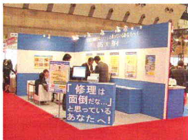
設営ブースの全景です!