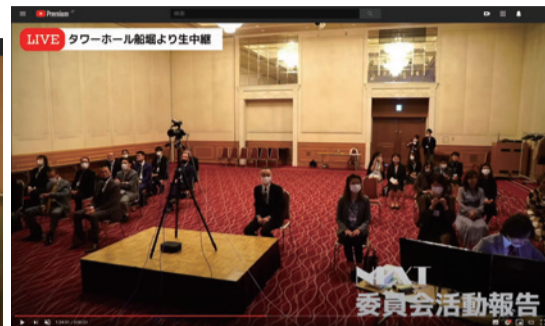
▲会場の様子。ソーシャルディスタンスOKです

臨場感という意味では実際の会場にはかきませんが、配信は見るべきものに焦点が当てられ情報が整理されていることもあって、内容の理解という点においては配信のほうが優れていたようです。